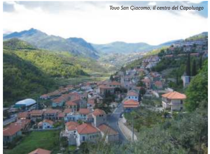
Tovo San Giacomo, il centro del Capoluogo

Nel 2007 saranno progettati l'abbattimento delle barriere architettoniche ed adeguamento normative sicurezza del Palazzo Comunale, lo studio di fattibilità per la riqualificazione di Piazza Umberto I (la piazza principale del paese) e delle aree limitrofe. Proseguiranno inoltre le azioni per progettare nuovi parcheggi e finanziare quelli già progettati. Verranno inoltre ripresi i contatti con gli altri Enti interessati per riattivare il progetto generale denominato "Oasi Fluviale del Maremola" già oggetto di una scheda CIPE per scopi turistici ed ambientali lungo il torrente Maremola redatto alcuni anni